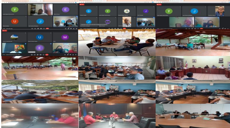
"Fortaleciendo Municipios para construir el Desarrollo"

✓ Se llevaron a cabo 12 Sesiones Ordinarias (mensuales) de la Federación, dos se llevaron de manera virtual, las demás se llevaron de manera presencial (Concejo Municipal de Distrito de Colorado, Concejo Municipal de Distrito de Monteverde, Concejo Municipal de Distrito de Peñas Blancas, Concejo Municipal de Distrito de Cervantes, Concejo Municipal de Distrito de Paquera, Concejo Municipal de Distrito de Cóbano, Sala de Reuniones de la Municipalidad de San José, Sala de Reuniones de la Municipalidad de San José, Sala de Reunión Chorotega de la Asamblea Legislativa, Sala de Reunión de la Asociación Nacional de Alcaldías e Intendencias). 10 Sesiones Extraordinarias cinco se llevaron de manera virtual y las demás se llevaron de manera presencial (Asamblea Legislativa, Despacho de la Diputada Paulina Ramírez Portuquez, Sala de Reuniones Turrialba de la Asamblea Legislativa, Asamblea Legislativa, Sala de Reuniones Turrialba de la Asamblea Legislativa, Sala de Reunión de la Asociación Nacional de Alcaldías e Intendencias). 1 Asamblea General Ordinaria se llevó de manera presencial en el Concejo Municipal de Distrito de Peñas Blancas, adjunto algunas fotos.